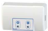
Boîtier d'alarme filaire