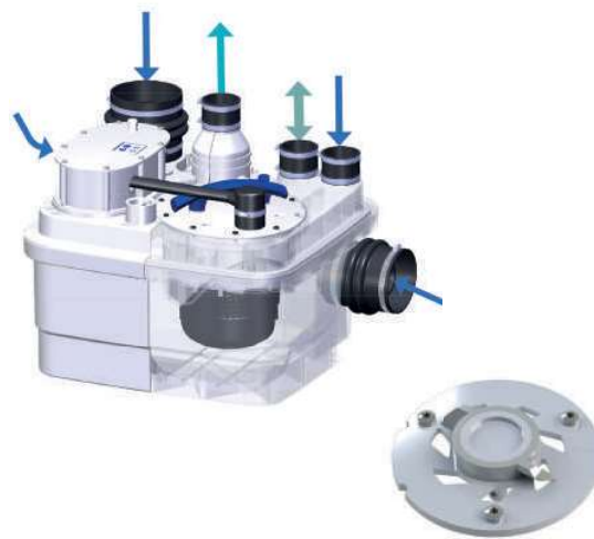
Roue dilacératrice Pro X K2